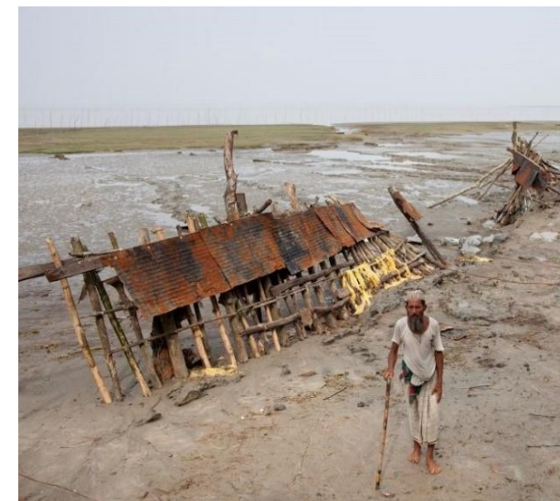
© Probal, Brot für die Welt, Bangladesch

https://hdk.ev-akademie-baden.de/tagungshaus/anreise/